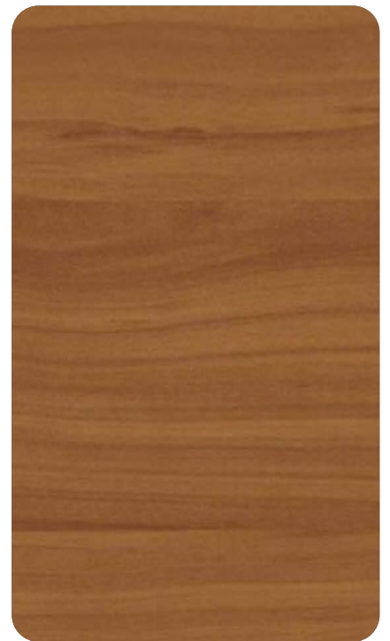
WALNUT BROWN Cod. BB402