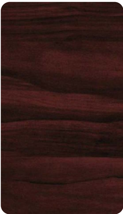
MAHOGANY BROWN Cod. BB405