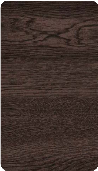
DARK OAK Cod. BB401