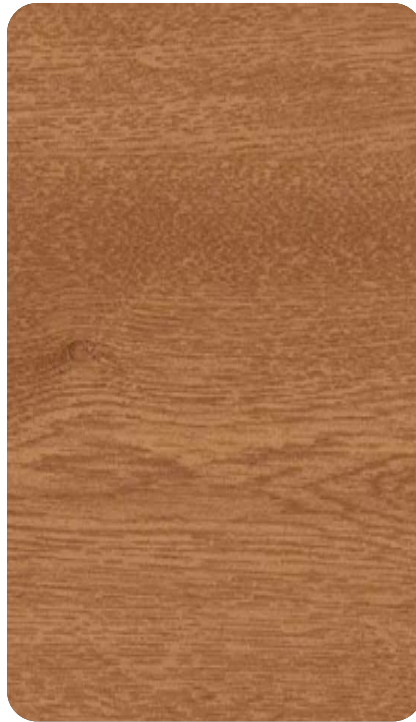
SCOTTISH OAK Cod. BB400