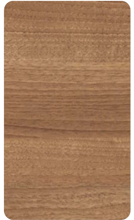
FRENCH WALNUT Cod. BB406