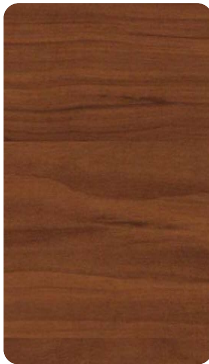
CEDAR BROWN Cod. BB403